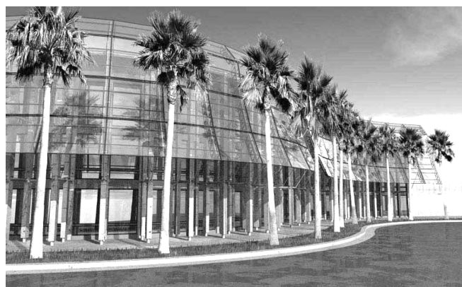
Siège de PharmaCorp (Biogene), situé au CBD (Haven)

Les plus malins d'entes vous (si, si, il y en a!) auront vu que ce tableau reprend les même malus que les "coups annoncés"!