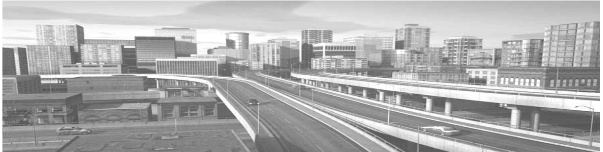
Centre gouvernemental de Poseidon (Haven)

11 jurés dont un président Juridiction au dessus des états-membres et des actes législatif de la Geo Pas plus d'un juré par état-membre de la Géo