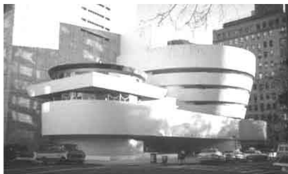
Le Cluster et son nouveau look, The Warf, Haven (Poseidon)