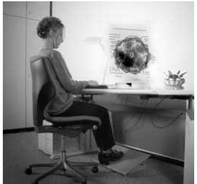
Etudiante travaillant sur la modélisation 3D d'une protéine.

Une nouvelle découverte ébranle le domaine de l'informatique, en 2025, TransWare commercialise la première interface neurale (Trodes).