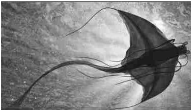
Image tirée d'une vidéo amateur près de la Muraille

Grace à une information anonyme, le Lieutenant Sakarov, se rendit sur une île près de New Hawaii, et a découvert avec stupeur un studio de tournage de films pornographiques. Mais l'inhumain n'a pas de limite, en effet, dans ces locaux plusieurs femmes, hommes et enfants ont été trouvés dans des conditions insalubres, et ne sortaient que pour tourner ces films sordides. Le Magistrat Skalford a immédiatement dépêché une cellule d'aide psychologique ainsi qu'une cellule d'enquête chargée de retrouver les familles de ces personnes disparues au yeux de leurs proches...